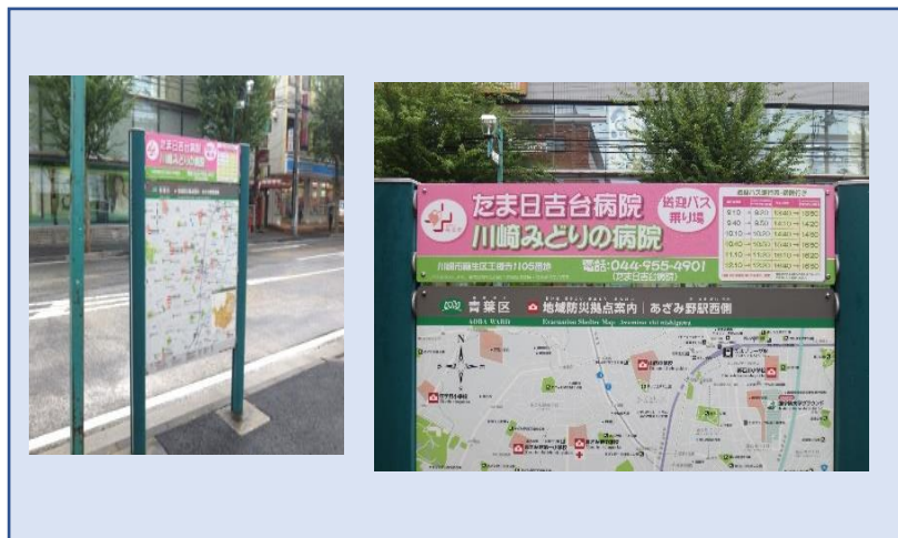
この看板の前に停車します