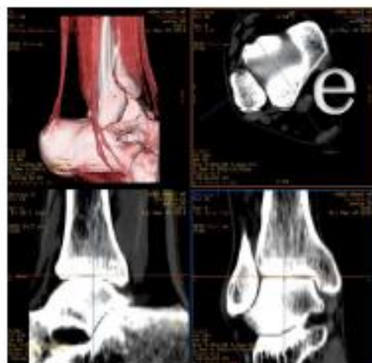
e.アキレス腱等、筋腱を強調した作画も可能